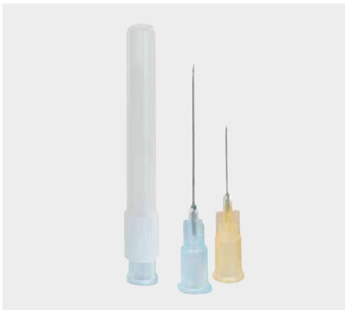
Aiguilles à usage unique Sterican® et Sterican Mix® : ancien design

» Manipulation et domaines d'utilisation inchangés