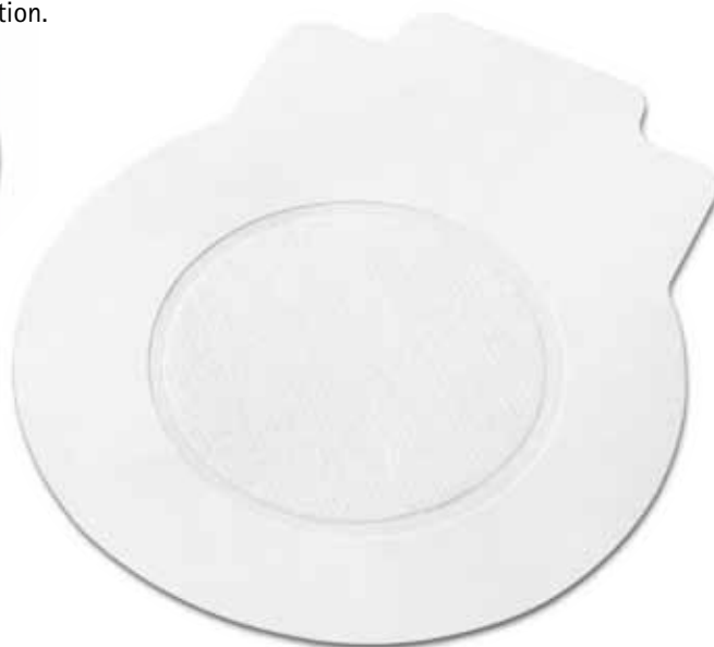
Feuille de protection avec centre non-adhésif