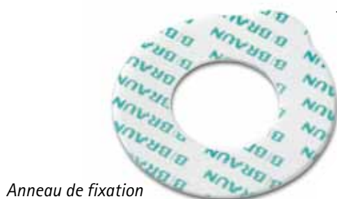
Anneau de fixation

Une conception plate qui assure au patient un confort optimal.